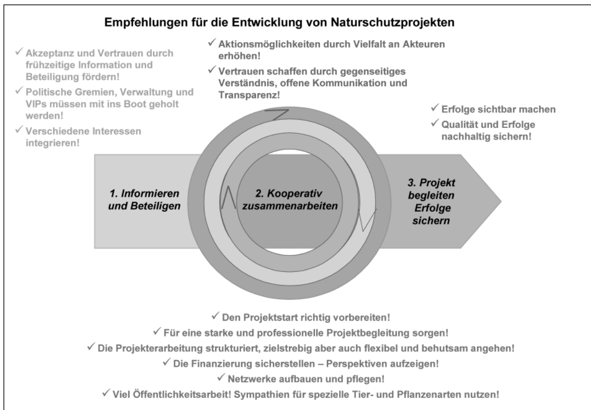
Abbildung 1: Übersicht über die in den Projektsteckbriefen genannten Erfahrungen und Empfehlungen für die Planung und Durchführung von Naturschutzprojekten

Viele der in den Projektsteckbriefen genannten Erfahrungen und Empfehlungen erscheinen beim ersten Lesen „banal“ oder „selbstverständlich“. In der Praxis scheitern die Vorhaben jedoch oft genau an diesen banalen Dingen: Wichtige Personen oder Rahmenbedingungen werden nicht ausreichend berücksichtigt oder Verfahrensschritte nicht eindeutig festgelegt. Die folgenden Empfehlungen stellen eine Synopse aller in den Projektsteckbriefen genannten Erfahrungen und Empfehlungen dar. Aus ihnen lässt sich eine Checkliste erstellen, die wichtige Schlüsselmomente im Projektverlauf nennt und Vorschläge zum richtigen Umgang damit gibt.