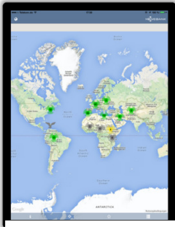
Der Hauptbildschirm als Geländekarte

Einführung gibt Ihnen eine kurze Übersicht über die Navigation in der App.