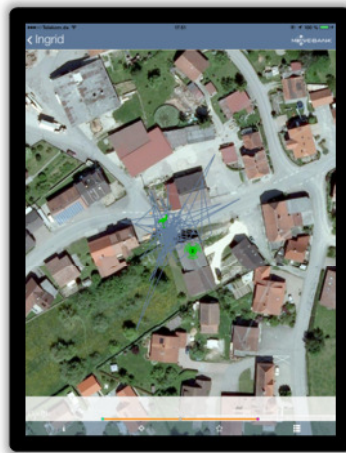
2 Wochen Bewegungsdaten von Störchin Ingrid